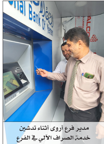
مدير فرع أروي أثناء تدشين خدمة الصراف الآلي في الفرع

كما سوف يتم تدريجياً استكمال وخلال الأيام القادمة تدشين عمل الصرافات الآلية في مواقع حيوية أخرى تشمل (نايتي مول وفندق المعلا بلازا ومطار عدن الدولي) ضمن المرحلة الأولى وبحسب الخطة المعدة من قبل الإدارة التنفيذية وكذا سوف تشمل الخطة في بقية محافظات الجمهورية.