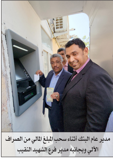
مدير عام البنك أثناء سحب المبلغ المالي من الصراف الآلي وبجانبه مدير فرع الشهيد النقيب

The Banker، منحت البنك الأهلي اليمني جائزتين كأفضل بنك في اليمن عامي: 2006 - 2007