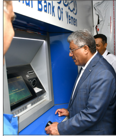
مدير عام البنك الأهلي اليمني أثناء تدشين خدمة الصراف الآلي في فرع أروي