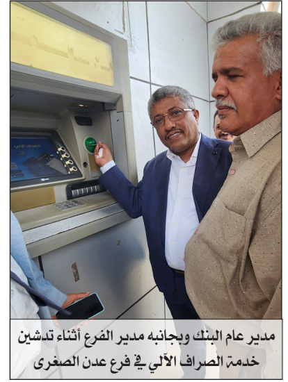
مدير عام البنك وبجانبه مدير الفرع أثناء تدشين خدمة الصراف الآلي في فرع عدن الصغرى