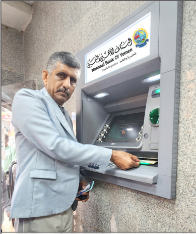
نائب المدير العام لشؤون الدوائر المساندة أثناء عملية التدشين فرع العيروس