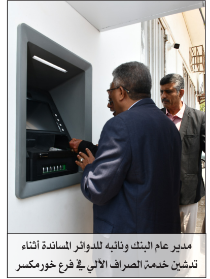
مدير عام البنك ونائبه للدوائر المساندة أثناء تدشين خدمة الصراف الآلي في فرع خورمكسر

الآلية لفحص وإجراءات عملية الفحص والمعالجات اللازمة للنظام ومن ثم عملية إطلاق النظام في البيئة الحية في هذا اليوم لجميع موظفين البنك وكذا جميع زبائن وعملاء البنك. وسوف يعقبها باذن الله إطلاق وتقديم خدمة بطاقات ماستر كارد وبمختلف أنواعها، بهدف تقديم أفضل الخدمات للعملاء، ولإنجاز معاملاتهم ومدفوعاتهم بالداخل والخارج وبكل يسر.