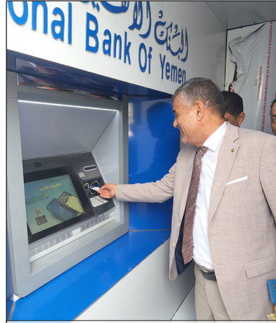
نائب المدير العام لشؤون الدوائر المصرفية أثناء عملية التدشين في فرع أروي