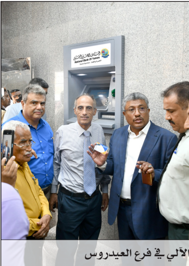
أثناء تدشين خدمة الصراف الآلي في فرع العيروس