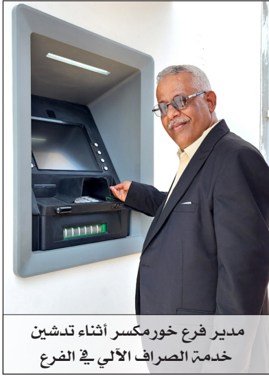
مدير فرع خورمكسر أثناء تدشين خدمة الصراف الآلي في الفرع