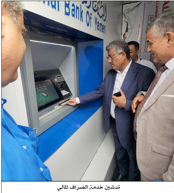
تدشين خدمة الصراف المالي

في ظل التغيرات الكبيرة في البيئة الاقتصادية والتكنولوجية. كما عمل على تدريب كوادره البشرية داخلياً وخارجياً لتواكب هذه التحولات المتسارعة وتقدم أفضل الخدمات للعملاء.