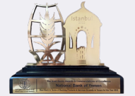
الاتحاد الدولي للمصرفيين العرب يمنح البنك الأهلي اليمني جائزة التميز أفضل بنك في اليمن وتطوير وتقديم الخدمات المصرفية للعام 2022