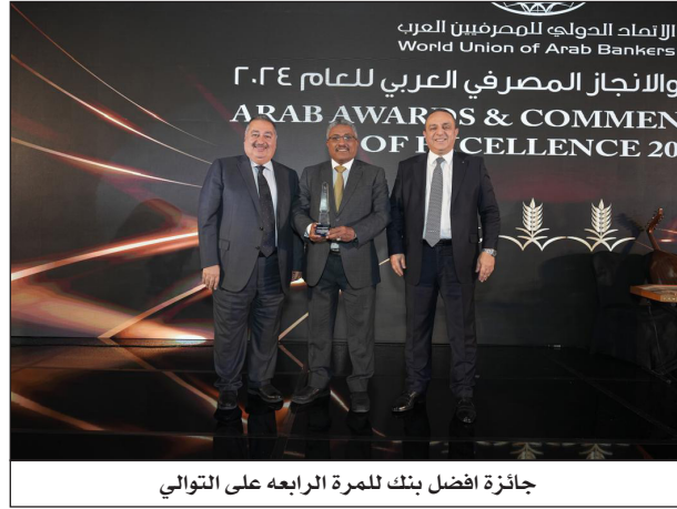
جائزة أفضل بنك للمرة الرابعة على التوالي