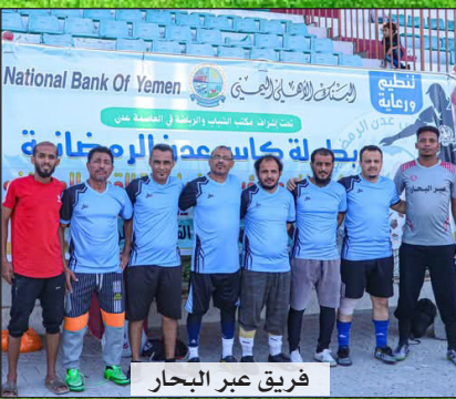
فريق عبر البحار