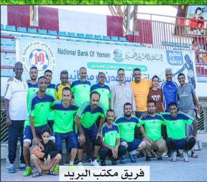
فريق مكتب البريد