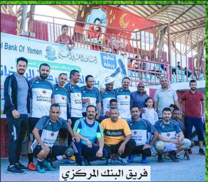
فريق البنك المركزي