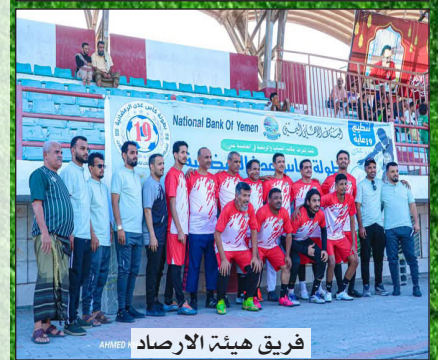
فريق هيئة الأرصاد