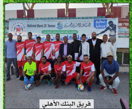
فريق البنك الأهلي