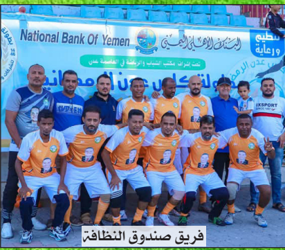
فريق صندوق النظافة

وفي المباراة الثانية التي جمعت فريقا هيئة الطيران والسراي لحساب المجموعة الأولى وانتهت بفوز فريق الطيران بنتيجة (0/2) ليحصد أول ثلاث نقاط في مشواره في البطولة. مجريات شوط المباراة الأول شهدت أحداثها